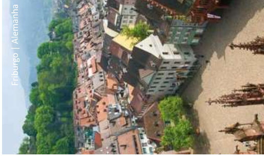
Friburgo | Alemanha