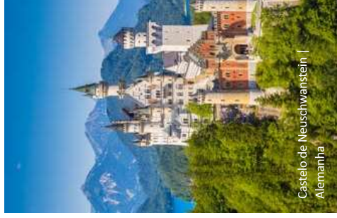
Castelo de Neuschwanstein | Alemanha

Após o café da manhã haverá uma visita guiada pela cidade de Nuremberg. Em seguida, saída para Frankfurt com parada na cidade de Würzburg, que forma o limite norte da “Rota Romântica”. Após a visita à cidade de Würzburg, a viagem continua para Frankfurt. O tour termina no Aeroporto de Frankfurt por volta das 17:00hs. Em seguida, parada no hotel Mövenpick para os passageiros com noites extras. Fim de nossos serviços.