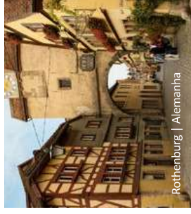
Rothenburg | Alemanha

Após o café da manhã, transferido ao aeroporto.