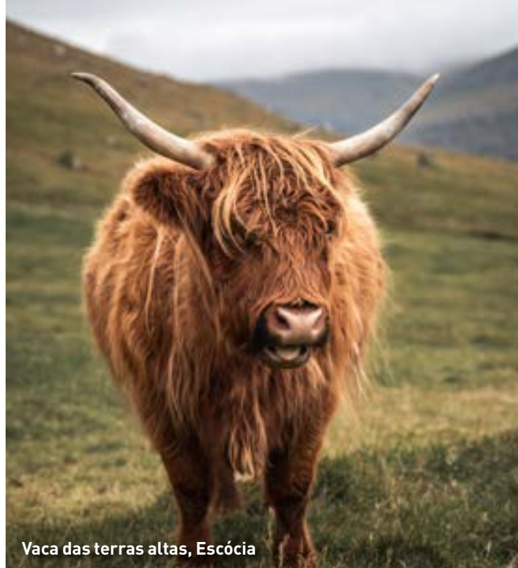
Vaca das terras altas, Escócia