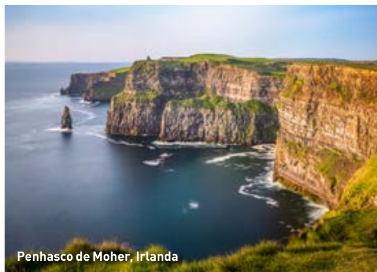
Penhasco de Moher, Irlanda

Passamos por Kenmare, Sneem, Waterville, Cahersiveen e Killorglin, antes de voltamos à Killarney novamente a partir do Sul, fazendo fronteira com os lagos de Killarney e o Parque Nacional de Killarney. Hospedagem e jantar.