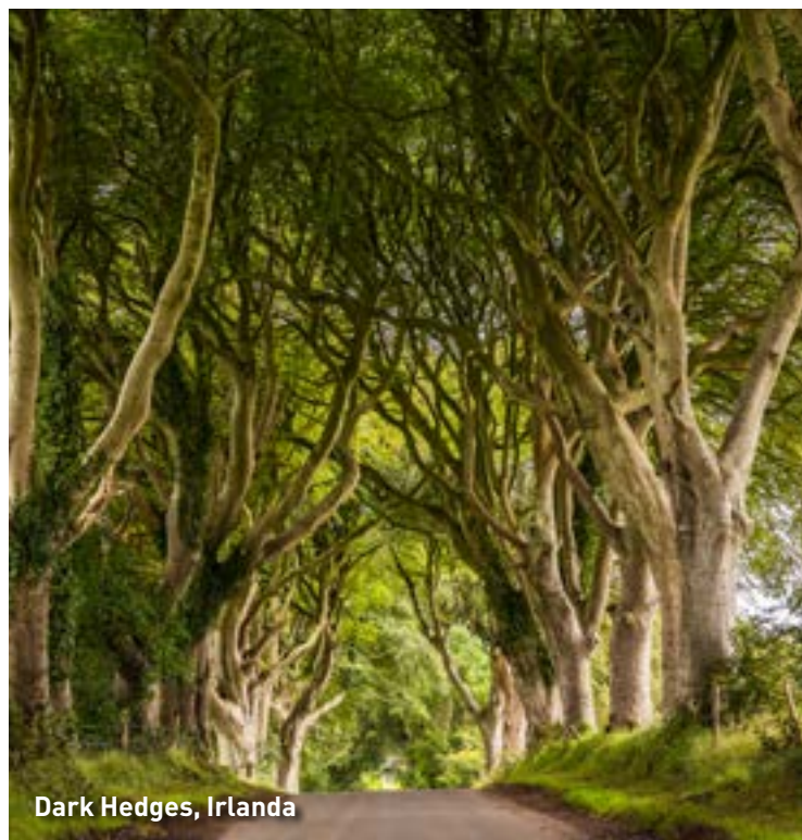
Dark Hedges, Irlanda