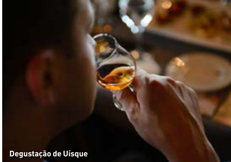
Degustação de Uísque

Cobre cerca de uns 180KM de estrada formando um círculo que começa em Killarney, ladeando a península de Iveragh.